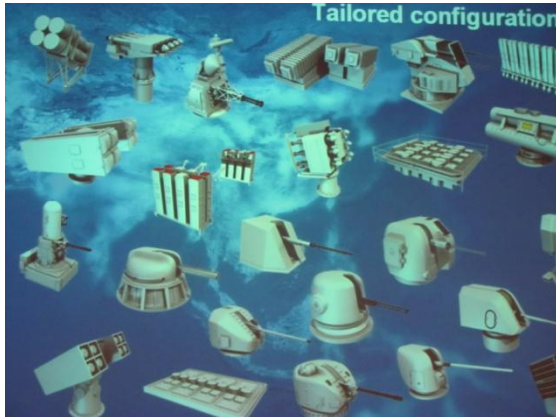
Thales Hengelo: Radardetectie en communicatietoepassingen

Op woensdag 4 april waren 30 Young professionals van de HTSP bedrijven te gast bij Thales in Hengelo.. HTSP organiseert drie programma's per jaar. Daarin staan een kennismaking met het bedrijf en zijn activiteiten en inhoudelijke thema's centraal. Vorig jaar waren we te gast bij Vanderlande Industries, Fokker Landing Gear en Philips Healthcare. Reden voor de collega's uit Hengelo om "het Zuiden" te bewegen naar Twente af te reizen.