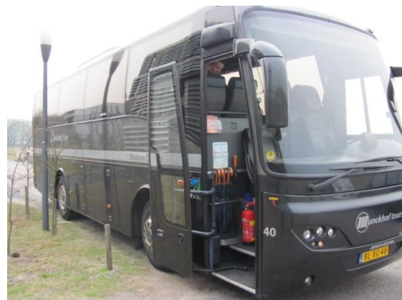
Vertrek bij het kantoor van FME Zuid. Een beetje VIP ben je wel als HTSP Young professional