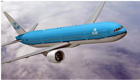
NLF: Vleugels uitslaan

Het NLF en topsector HTSM zullen de komende maanden per activiteit bekijken op welke wijze het NLF kan deelnemen met als doel elkaar op het terrein van Human Capital aan te vullen. Naar verwachting komen daar ook nieuwe initiatieven uit voort.