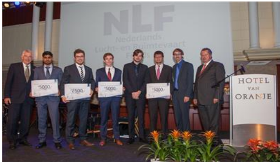
Winnaars van de awards 2015