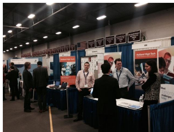
The Dutch street. Ready to meet!

is Duitsland daar ruim vertegenwoordigd met vele bedrijven en kennisinstituten. Maar ook landen als Frankrijk, Zwitserland en zelfs Spanje laten zich niet onbetuigd. Vele honderden, zo niet duizenden, geïnteresseerden oriënteren zich bij de diverse stands. Dit jaar bestond de Nederlandse inzending uit ASML, AkzoNobel, TomTom, Brainport Development, de TU Delft en Holland High Tech. Brainport Development en Holland High Tech hadden de handen ineen geslagen om